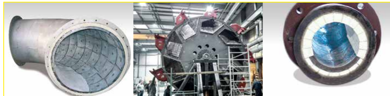
KALCAST und KALCRET Verwendung in einem Shreddersystem für Kunststoffabfälle